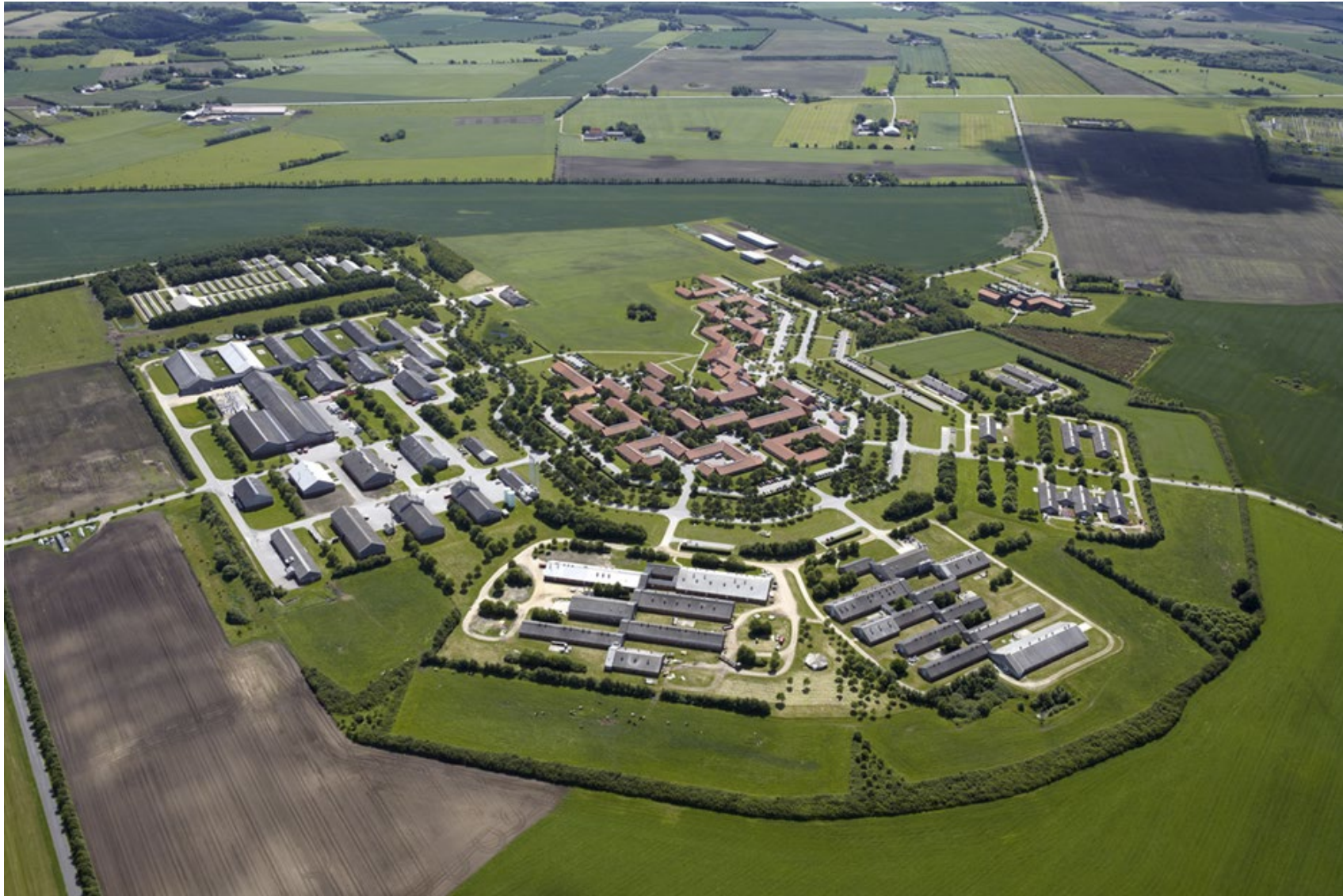
AU Viborg – Forskningscenter Foulum